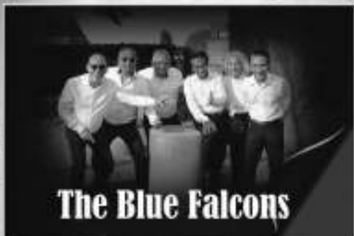
The Blue Falcons