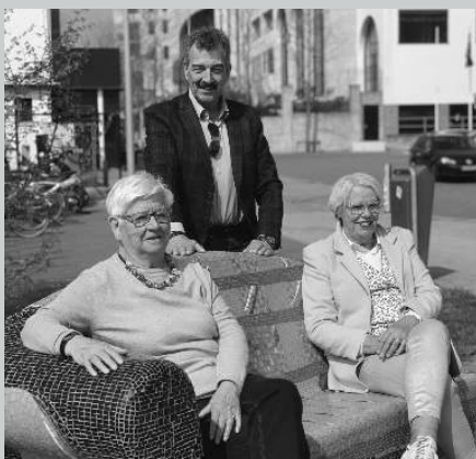
Social Sofa pag.2