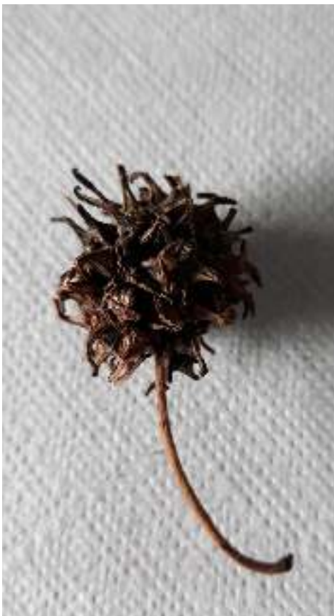
Vrucht Amberboom, artikel Ode aan de bomen

Groeten, een anonieme ambtenaar die de Welterkoerier onder ogen kwam